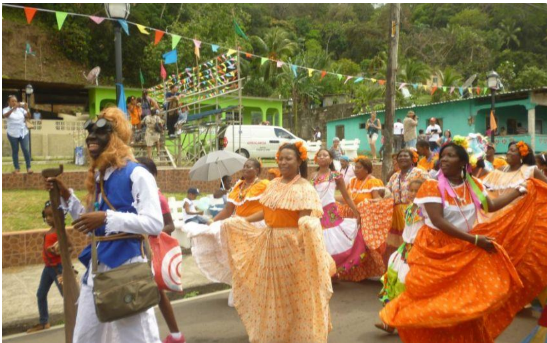
IMAGEN 4: FOTO DISTRITO DE SANTA ISABEL