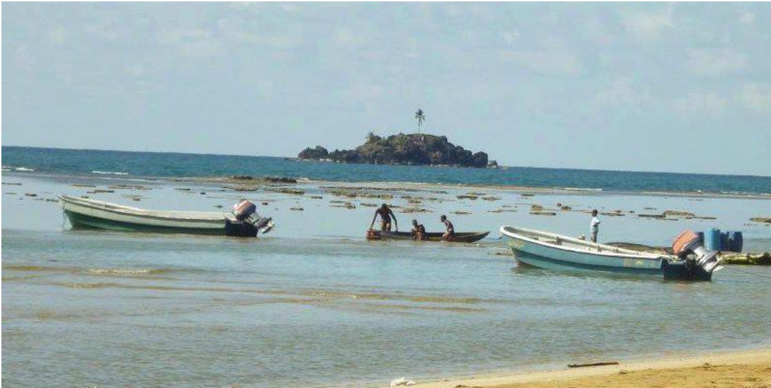
IMAGEN 3: FOTO DISTRITO DE SANTA ISABEL